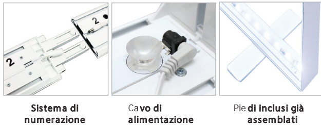
Sistema di numerazione