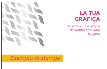
RISULTATO STAMPATO con Nobilitazione