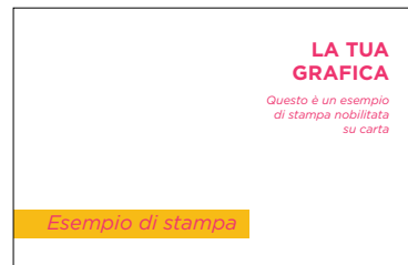
PDF CMYK contenente la grafica a colori senza la parte con nobilitazione

I due file inviati devono combaciare perfettamente ed essere delle stesse dimensioni