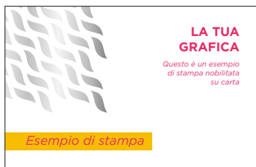
RISULTATO STAMPATO con Nobilitazione