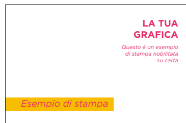
PDF CMYK contenente la grafica a colori senza la parte con nobilitazione