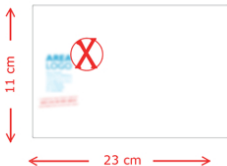
No Bassa Risoluzione

In questo caso, i testi e le immagini dopo la stampa risulteranno sgranati, sfuocati o di lettura difficile poichè è stato inviato un file a bassa risoluzione.